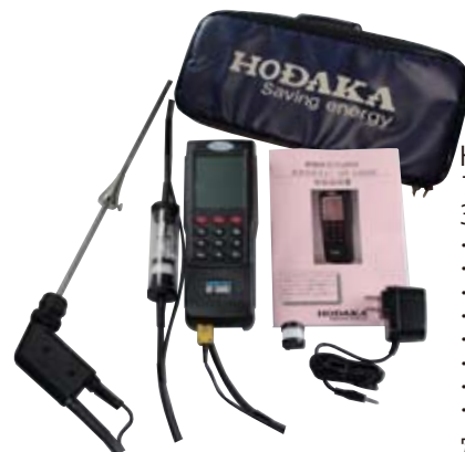
HT-1300X プローブチューブ 300mm セット